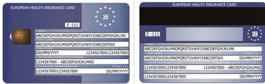
Figura 1: Modelli di carta sanitaria europea (carta dotata di chip e carta leggibile a occhio nudo) sulla cui base gli Stati membri dovranno realizzare le tessere nazionali

I partner di progetto appartengono ai seguenti Stati: Austria, Finlandia, Francia, Germania, Grecia, Italia, Repubblica Ceca, Slovacchia, Slovenia, e Ungheria. Per ogni Stato sono previsti siti pilota con il coinvolgimento di più strutture sanitarie. L'Italia partecipa con Regione Lombardia e Regione Veneto.