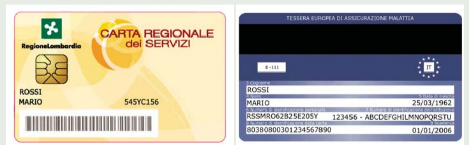
Figura 3: Carta Regionale dei Servizi di Regione Lombardia. Sul retro è riportata la Tessera Europea Assicurazione Malattia

Il progetto, che è entrato nella seconda fase, si svilupperà in 18 mesi ed è basato sulla realizzazione di un sistema che consenta di condividere dati e informazioni relativi ai pazienti grazie all'uso della carta sanitaria. L'architettura del sistema prevede la realizzazione di una work-station interoperabile capace di leggere le differenti carte sanitarie europee e/o scaricare i dati dai diversi portali nazionali attraverso l'interconnessione a una rete extranet sicura (Figura 2).